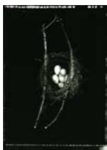
Fiona Pardington 費安娜·巴亭登

The artists will give a talk about the works at 6:30 pm on Tuesday 18 March 2008 at One Capital Place Telephone enquiries : ( 852 ) 2525 5044